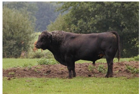
Race Limousine (France)