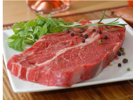
Viance de bœuf français

Au Japon, jusqu'en 1868 la viande de bœuf n'était pas consommée en majorité pour des raisons religieuses (bouddhisme). Le bœuf était alors un animal de trait.