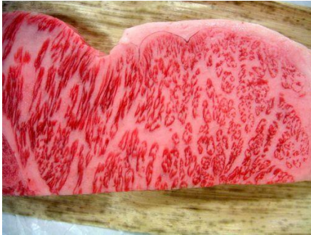
Viande de bœuf japonais

On a tous entendu parler du bœuf de Kobe, mais ce qu'une des 45 appellations de bœuf japonais qui sont toutes d'intérêt. La viande de bœuf japonais (ou Wagyu) est bien différente de celle que nous mangeons en Europe, voire dans le reste du monde ! La première différence est visuelle. L'aspect de la viande est caractérisé par la présence de très nombreux filaments de graisse (on parle d'une viande « persillée »). La viande de bœuf au Japon est donc plus grasse et en conséquence plus gouteuse et plus tendre, comme l'illustre ces clichés (autre aspect de la photo duo de la première page)