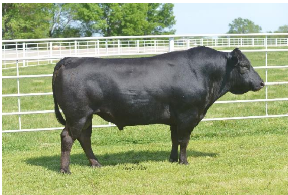
Bœuf Wagyu (Japon)

Dans ce numéro : quelques visites de collègues japonais, un FJS polymères, une AG, un Ministre japonais et un petit aperçu sur le bœuf de Kobe